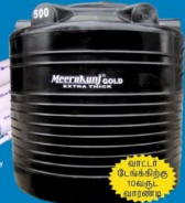
சாட்டி உருக்கி பார்க்க