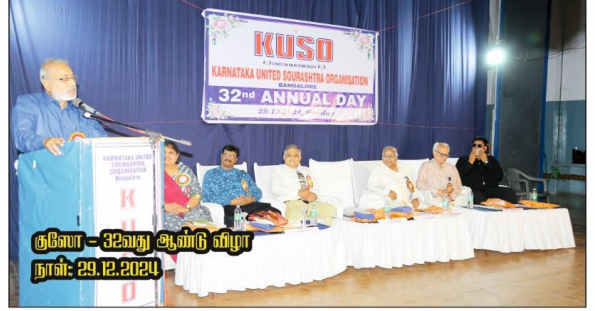
குஸோ - 32வது ஆண்டு விழா நாள்: 29.12.2024