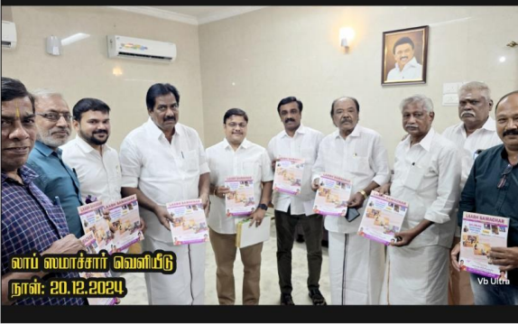
வாய் ஸமாச்சார் வெளியீடு நாள்: 20.12.2024