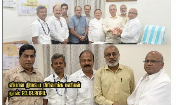
விமான நிலைய வரிவாக்க பணிகள் நாள்: 23.12.2024