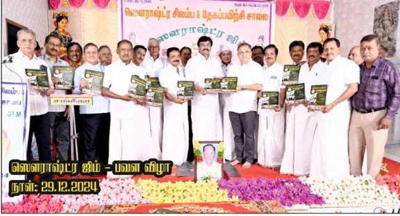
ஸௌராஷ்டிர ஜிம் - பவன விழா நாள்: 29.12.2024