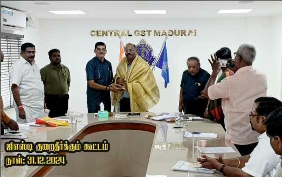
ஜிஎஸ்டி குறைதீர்க்கும் கூட்டம் நாள்: 31.12.2024