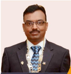
Prop.: B.S. Rajan