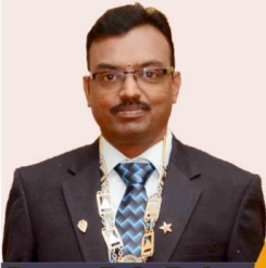
Prop.: B.S. Rajan