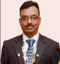
Prop.: B.S. Rajan