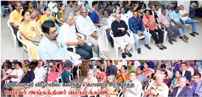
முப்பெரும் விழாவில் கலந்து கொண்டு சிறப்பித்த சேம்பர் அங்கத்தினர் பெருமக்கள்