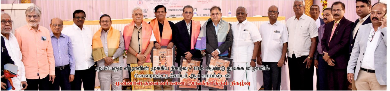
முப்பெரும் விழாவின் முக்கிய நிகழ்வு: 18ம் ஆண்டு துவக்க விழாவில் ஸெளராஷ்ட்ர சேம்பர், ஆய் காமாஸ்-ன் முன்னாள் தலைவர்களை அங்கீகரிக்கும் நிகழ்வு