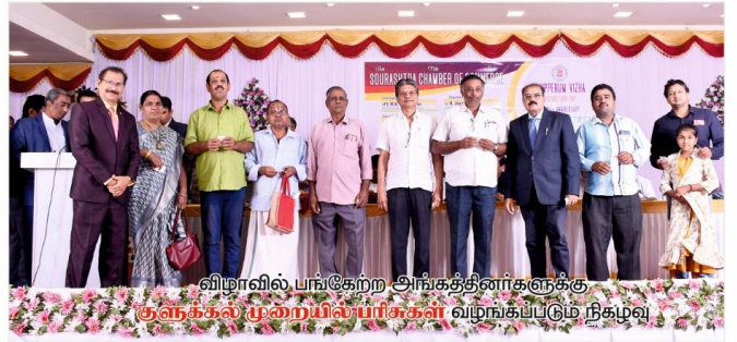
விழாவில் பங்கேற்ற அங்கத்தினர்களுக்கு குணக்கல் முறையில் பரிசுகள் வழங்கப்படும் நிகழ்வு