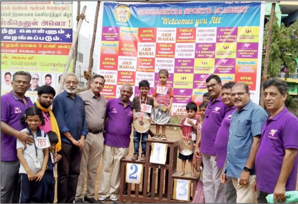
லெளராஷ்டர் ஸ்போர்ட்ஸ் அகாடமி சார்பில் 03.12.2023 அன்று லெளராஷ்டர் ஆண்கள் மேல்நிலைப்பள்ளி வளாகத்தில் ஏற்பாடு செய்யப்பட்ட லெளராஷ்டர் ஸ்போர்ட்ஸ் தின்னார் 2023 நிகழ்ச்சியில், நமது லெளராஷ்டர் சேம்பர் ஆப் காமர்ஸ் நிர்வாகிகள் கலந்து கொண்டு வெற்றி பெற்றவர்களுக்கு பரிசுகளை வழங்கியது. இந்த நிகழ்வில், 5 வயது முதல் 80 வயது வரையிலான குழந்தைகள், பெண்கள், ஆண்கள் பலர் போட்டியில் கலந்து கொண்டனர்.