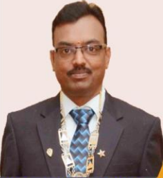
Prop.: B.S. Rajan

• CCTV Camera • Long Distance Monitor • Security Alarm • Digital Video Recorder • Voice Records • Access Control System • Firm Alarm • Audio & Video Door Phones