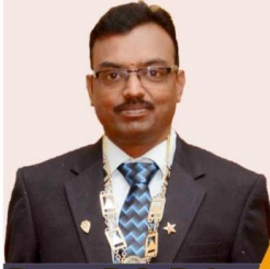
Prop.: B.S. Rajan