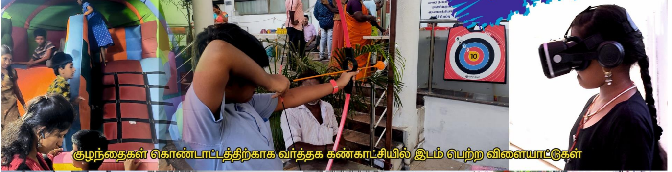
குழந்தைகள் கொண்டாட்டத்திற்காக வர்த்தக கண்காட்சியில் இடம் பெற்ற விளையாட்டுகள்