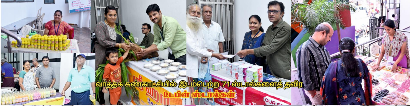
வர்த்தக கண்காட்சியில் இடம்பெற்ற 71 ஸ்டால்களைத் தவிர பேபி ஸ்டால்கள்