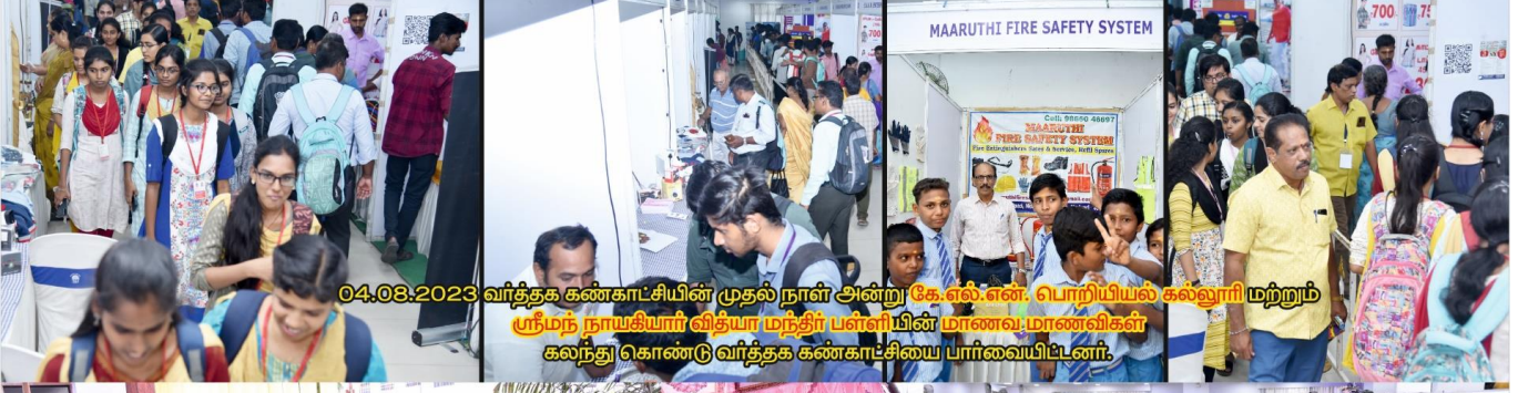
04.08.2023 வர்த்தக கண்காட்சியின் முதல் நாள் அன்று கே.எல்.என். பொறியியல் கல்லூரி மற்றும் ஸ்ரீமந் நாயகியார் வித்யா மந்திரி பள்ளியின் மாணவ.மாணவிகள் கலந்துகொண்டு வர்த்தக கண்காட்சியை பார்வையிட்டனர்.