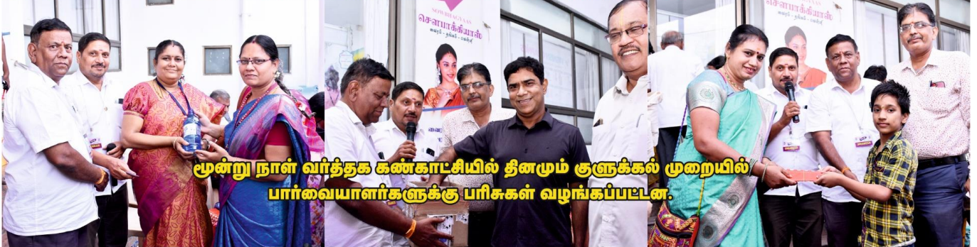
மூன்று நாள் வர்த்தக கண்காட்சியில் தினமும் குளுக்கல் முறையில் பார்வையாளர்களுக்கு பரிசுகள் வழங்கப்பட்டன.