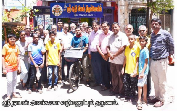
ஸ்ரீ நாயன் அவர்களை வழியனுப்பும் தருணம்.