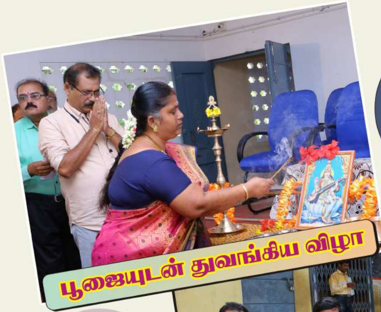
பூஜையுடன் துவங்கிய விழா