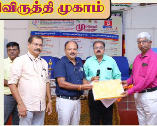
தொழில் அபிவிருத்தி முகாம்