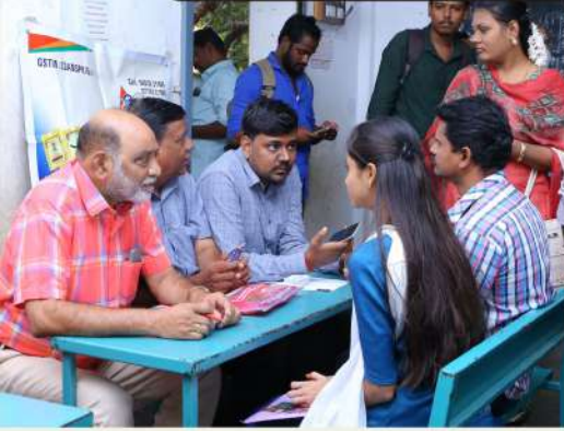
தொழில் வாய்ப்பு முகாம்