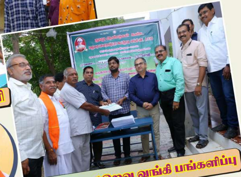
ஸௌ. கூட்டுறவு வங்கி பங்களிப்பு