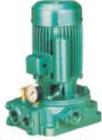
Single Phase Jet Pumps

76, South Avani Moola Street, Madurai - 625 001. Phone : 0452 - 2621523 B.O.: 32-A, Athikulam Main Road, New Natham Road, Madurai - 625 014.