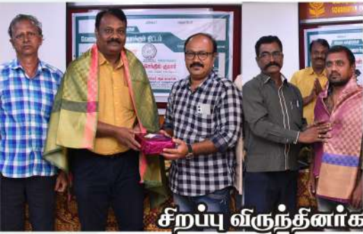
சிறப்பு விருந்தினர்களை கௌரவித்தல்