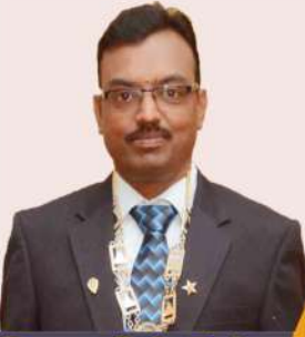
Prop.: B.S. Rajan

Agricultural Monoblocks Open-well Submersibles Pressure Boosting Systems