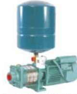
Pressure Boosting Systems