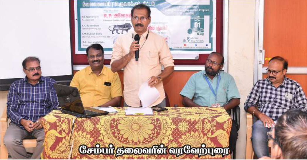
சேம்பர் தலைவரின் வரவேற்புரை