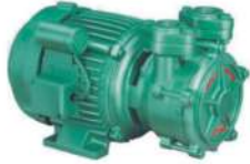
Single Phase Domestic Pumps