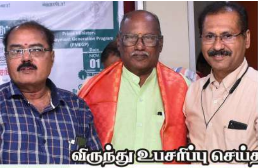
விருந்து உபசர்ப்பு செய்தவர்களை கௌரவித்தல்