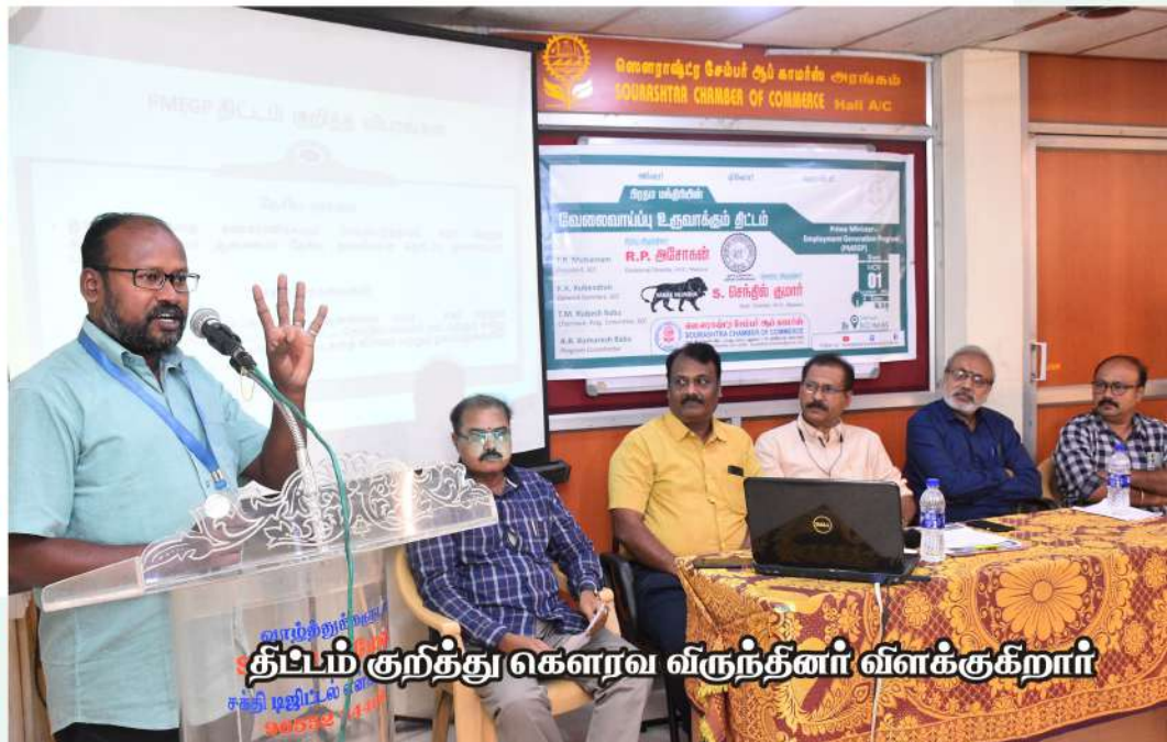
திட்டம் குறித்து கௌரவ விருந்தினர் விளக்குகிறார்