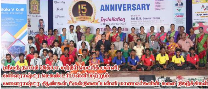
புதிதாய் வித்யா மற்றும் மெட்ரிக் பள்ளி, ஸௌராஷ்டிர செகண்டரி பள்ளி மற்றும் ஸௌராஷ்டிர ஆண்கள் மேல்நிலைப்பள்ளி மாணவர்களின் குழுவும் சேர்ந்து