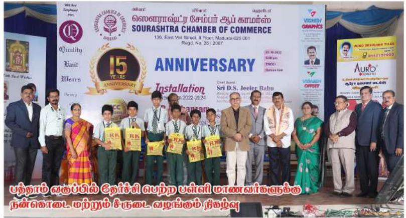
புதிதாய் வித்யா மற்றும் மெட்ரிக் பள்ளி மாணவர்களுக்கும் நன்றாகவும் மற்றும் சீருடை வழங்கும் நிகழ்வு