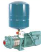
Pressure Boosting Systems