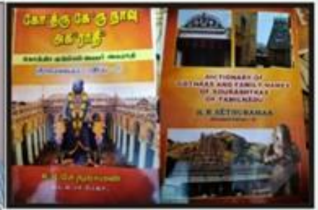
- திம்மா. பிரகாஷ் குமார்