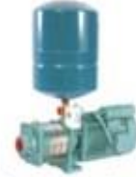
Pressure Boosting Systems