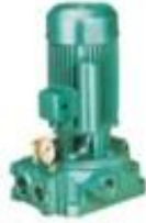
Single Phase Jet Pumps

Agricultural Monoblocks Open-well Submersibles Pressure Boosting Systems