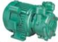
Single Phase Domestic Pumps