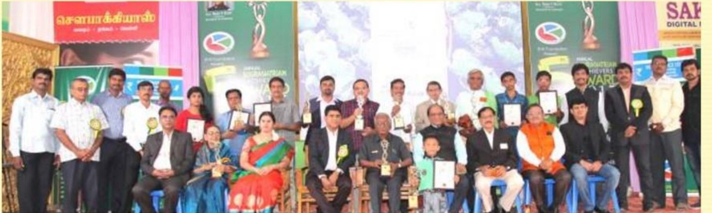
B V K Award Function - SITCON - 2017

அனைத்து சிட்கான் நிறைவிலும் B V K பவுண்டேசன் சார்பில் சாதனையாளர்களுக்கு விருது வழங்கப்பட்டது.