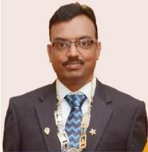
Prop.: B.S. Rajan