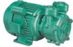
Single Phase Domestic Pumps