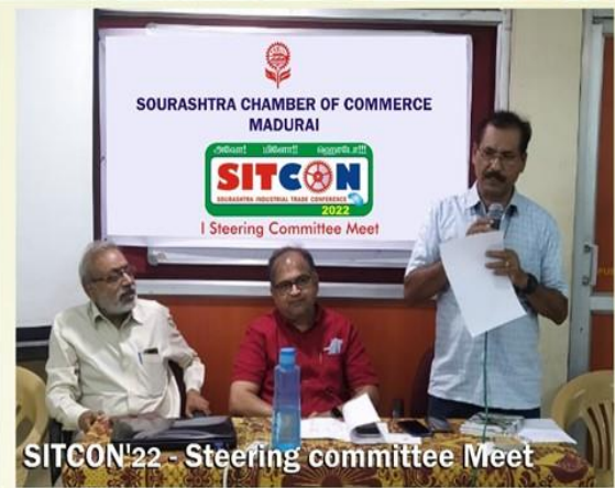
SITCON'22 - Steering committee Meet