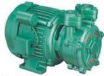
Single Phase Domestic Pumps