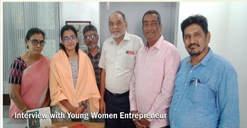
Interview with Young Women Entrepreneur