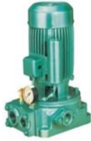
Single Phase Jet Pumps

Agricultural Monoblocks Open-well Submersibles Pressure Boosting Systems