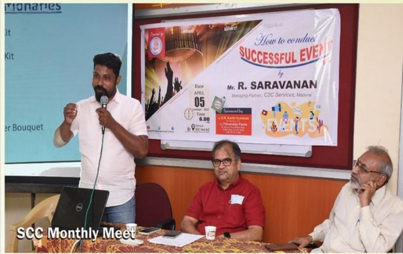
SCC Monthly Meet