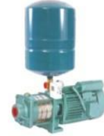
Pressure Boosting Systems