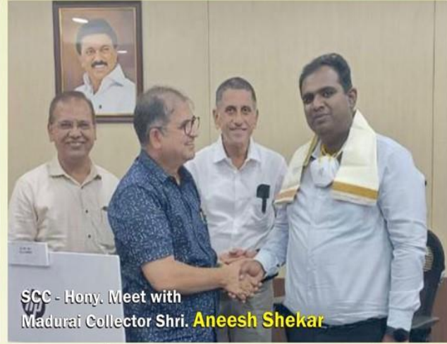
SCC - Hony. Meet with Madurai Collector Shri. Anesh Shekar