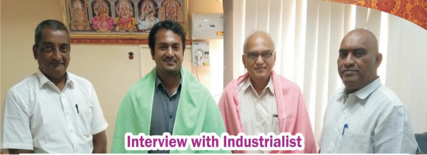
Interview with Industrialist