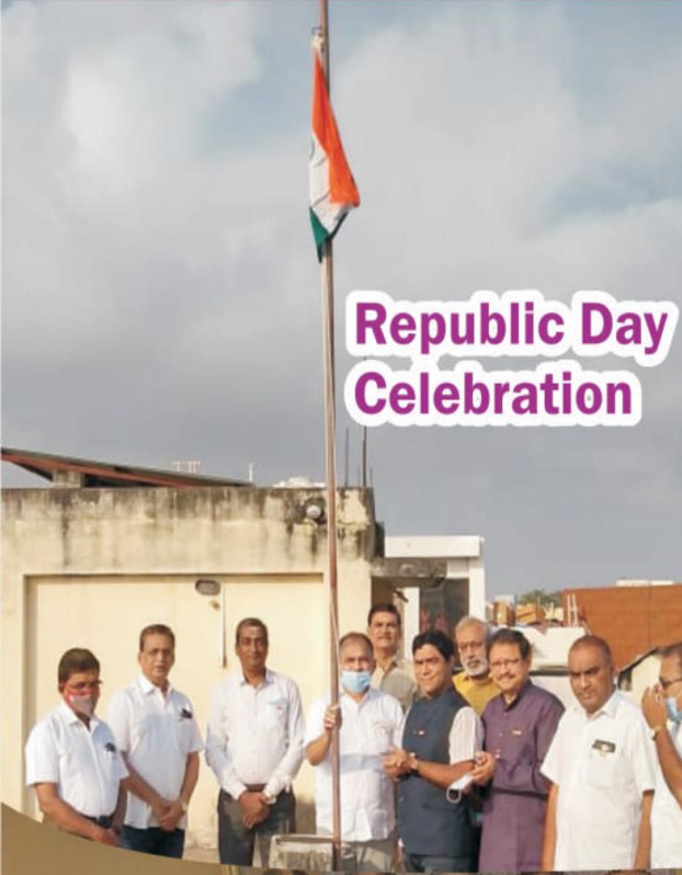
Republic Day Celebration

official Publication SOURASHTRA CHAMBER OF COMMERCE