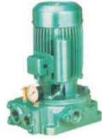
Single Phase Jet Pumps