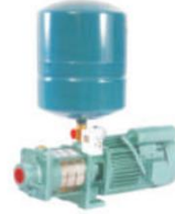
Pressure Boosting Systems