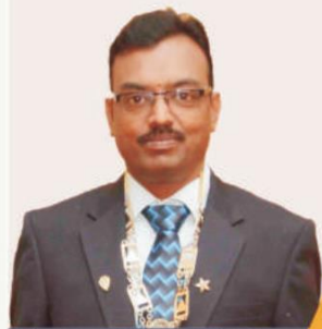
Prop.: B.S. Rajan