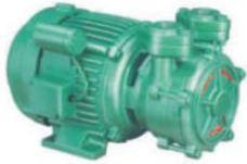
Single Phase Domestic Pumps