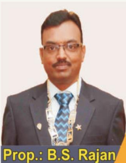
Prop.: B.S. Rajan