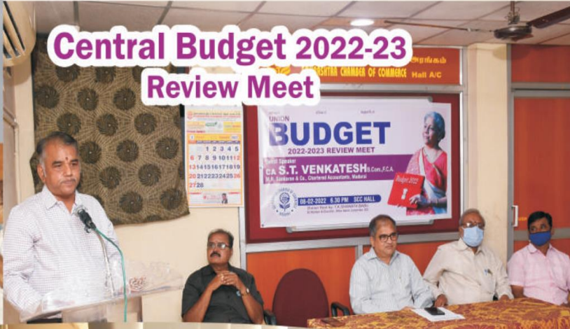
Central Budget 2022-23 Review Meet