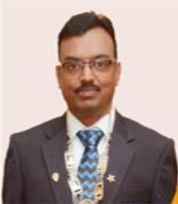
Prop.: B.S. Rajan