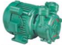
Single Phase Domestic Pumps