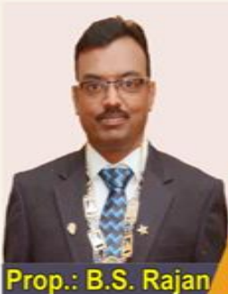
Prop.: B.S. Rajan