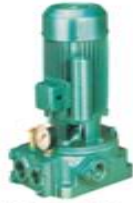
Single Phase Jet Pumps

76, South Avani Moola Street, Madurai - 625 001. Phone : 0452 - 2621523 B.O.: 32-A, Athikulam Main Road, New Natham Road, Madurai - 625 014.