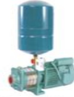
Pressure Boosting Systems