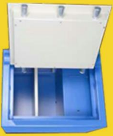
size: 24" * 18" * 18"