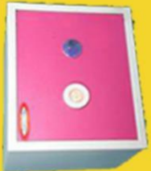
size: 15" * 18" * 12"