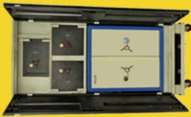
size: 78" * 36" * 18"