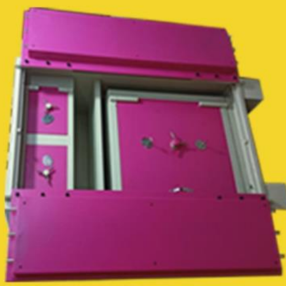
size: 66" * 36" * 24"