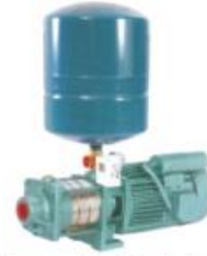
Pressure Boosting Systems