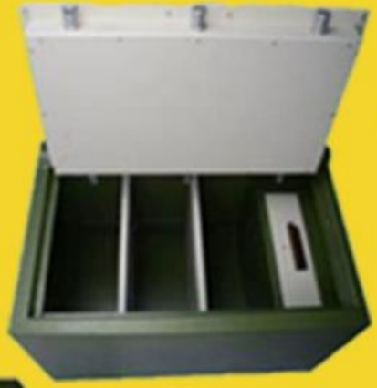
size: 36" * 24" * 21"