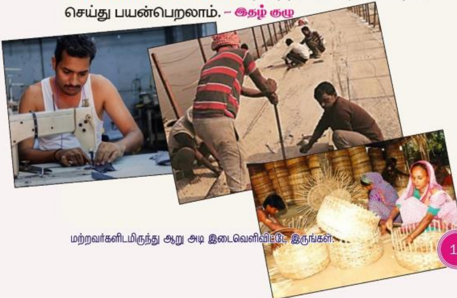
மற்றவர்களிடமிருந்து ஆறு அடி இடைவெளிவிட்டே இருங்கள்.

விவசாயத் தொழிலாளர்கள், மீனவர்கள், பால்காரர்கள், அங்கன்வாடி தொழிலாளர்கள், தெரு விற்பனையாளர்கள், வீட்டு வேலை செய்பவர்கள், ரிக்ஷா இழுப்பவர்கள், MGNREGA - மகாத்மாக காந்தி ஊரக வளர்ச்சி தொழிலாளர்கள், கட்டிடத் தொழிலாளர்கள், gig தொழிலாளர்கள் (பணி நிரந்தரமற்ற / கான்ட்ராக்ட் அடிப்படையிலான தொழிலாளர்கள், உணவு டெலிவரி செய்யும் தொழிலாளர்கள் போன்றோர்), பிளாட் ஃபார்ம் தொழிலாளர்கள் போன்றவர்கள் இந்த இ-ஷிரம் https://www.eshram.gov.in/ தளத்தில் முறையாக பதிவு செய்து பயன்பெறலாம். - ஆகழ் குழு