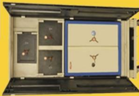
size: 78" * 36" * 18"