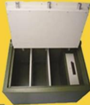
size: 36" * 24" * 21"