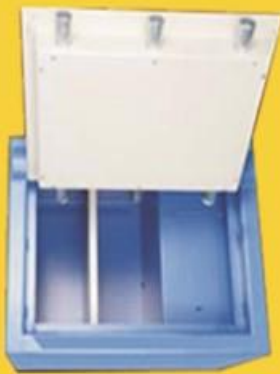
size: 24" * 18" * 18"