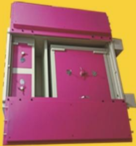
size: 66" * 36" * 24"