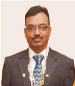
Prop.: B.S. Rajan