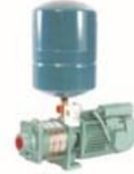
Pressure Boosting Systems