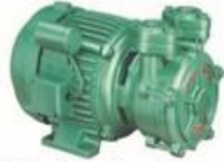
Single Phase Domestic Pumps