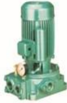
Single Phase Jet Pumps

76, South Avani Moola Street, Madurai - 625 001. Phone : 0452 - 2621523 B.O.: 32-A, Athikulam Main Road, New Natham Road, Madurai - 625 014.