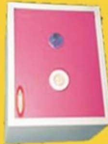
size: 15" * 18" * 12"