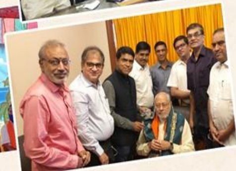
கொரோனா நிவாரணப் பணியில் உதவி செய்வதற்காக நமது மொக. ஆணைகள் மேல்முறையீடு உள்ளிட வேண்டுகோள்.