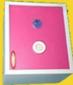
size: 15" * 18" * 12"