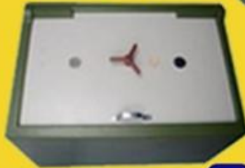
size: 36" * 24" * 21"