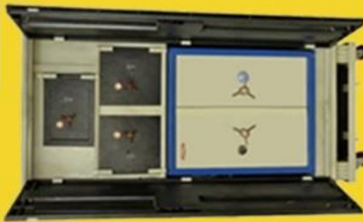
size: 78" * 36" * 18"