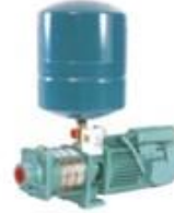
Pressure Boosting Systems