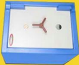
size: 24" * 18" * 18"