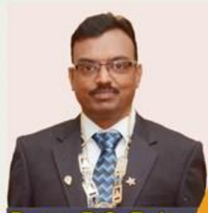
Prop.: B.S. Rajan