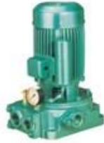
Single Phase Jet Pumps

76, South Avani Moola Street, Madurai - 625 001. Phone : 0452 - 2621523 B.O.: 32-A, Athikulam Main Road, New Natham Road, Madurai - 625 014.