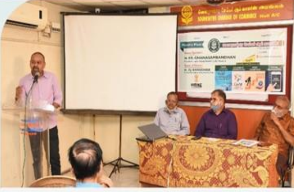
10ம் பக்க தொடர்ச்சி...

நிறைவாக, தற்போது ஆளும் மத்திய அரசு தொழில் நிறுவனங்களின் வளர்ச்சிக்குத் தேவையான முயற்சிகளை சிறப்பாக செய்து வருகிறது என்று கூறி தனது உரையை நிறைவு செய்தார். மேற்படி ஒவ்வொரு தலைப்பின் நிறைவுகற்பிற்ரு, அங்கத்தினர்களின் சந்தேகங்களுக்கு மிகத் தெளிவாக பதிலளித்தார்.