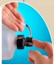
Hand Pressing ಉಪಕರಣ