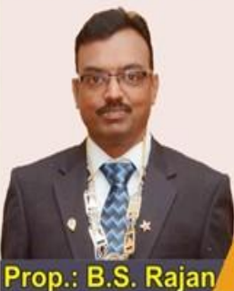
Prop.: B.S. Rajan