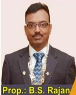
Prop.: B.S. Rajan