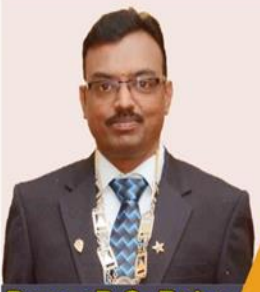
Prop.: B.S. Rajan