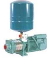
Pressure Boosting Systems