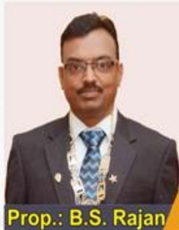
Prop.: B.S. Rajan

குறு, சிறு, நடுத்தரத் தொழில்கள் துறை அமைச்சகம் கையாளும் அனைத்துப் பிரச்சினைகளுக்கும் ஒரே இடத்தில் தீர்வு காணும் இணையதளமாக இது இருக்கும்.