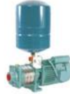
Pressure Boosting Systems