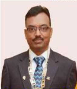
Prop.: B.S. Rajan