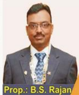
Prop.: B.S. Rajan