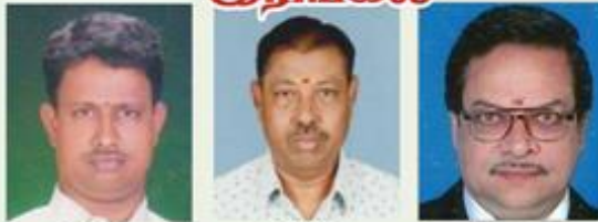
மறைவு: 16.02.2020 மறைவு: 26.02.2020 மறைவு: 04.03.2020