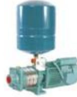
Pressure Boosting Systems