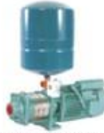
Pressure Boosting Systems