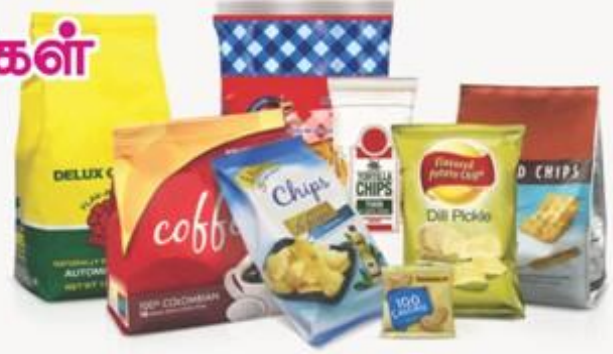
இது இனி மாறுகிறது.

அதன்படி பிளாஸ்டிக்கை பயன்படுத்தி செய்யப்படும் பேக்கிங்குள் மட்டுமின்றி காகிதம், காகித அட்டை போன்றவற்றினால் செய்யப்படும் பேக்கிங்குகளும் விதிமுறைகள் அல்லது தர அளவுகளுக்கு உட்படுத்தப்படும் என தெரிகிறது. தற்போதைய நடைமுறையில் பேக்கிங் மற்றும் லேபுளிங் (Packaging & Labeling) ஆகிய இரண்டும் ஒரே விதிமுறையின் கீழ் இருந்து வருகிறது.