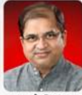
குமரன் 8 ஐதவா

சிடகான் 2019 மாநாட்டின் பிரவுச்சர் வெளியீட்டு விழா வெகு விமரிசையாக கொண்டாடப்பட்டது. இவ்விழாவிற்கு வருகை தந்த அனைத்து சேம்பர் அங்கத்தினர்கள், முக்கிய பிரமுகர்கள் அனைவருக்கும் எனது நெஞ்சார்ந்த நன்றிகளை தெரிவித்துக்கொள்கிறேன். பிரவுச்சர் வெளியீட்டு விழா அரங்கம் நிறைந்து காணப்பட்டது மகிழ்ச்சியளிக்கிறது. இதே ஆர்வத்துடன் ஆகஸ்டு மாதத்தில் நடைபெற இருக்கும் சிடகான் மாநாட்டிலும் கலந்து கொள்ள வேண்டும் என்று விரும்புகிறேன்.