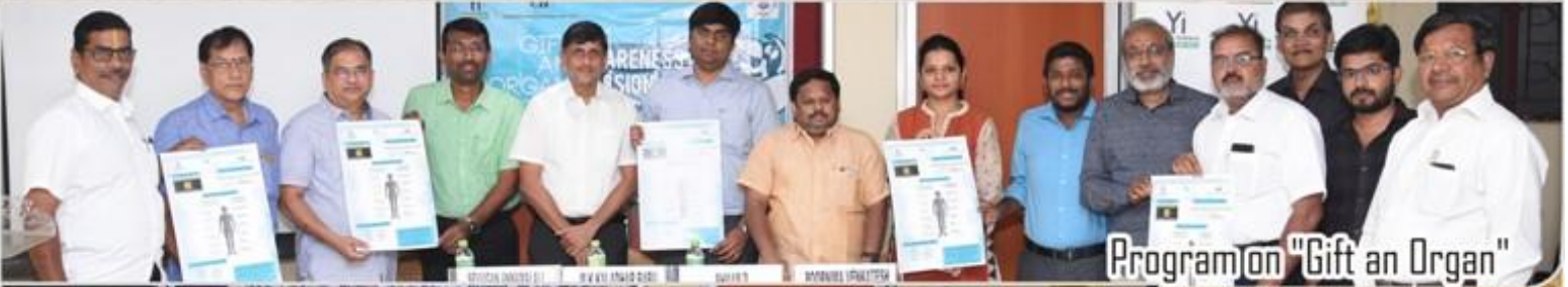
Program on "Gift an Organ"

HEAD OFFICE : Plot No 264, LIG Colony, Off Lake View Road , KK Nagar , Madurai - 625 020 Contact : 81108 11180 Email: info@energyls.in