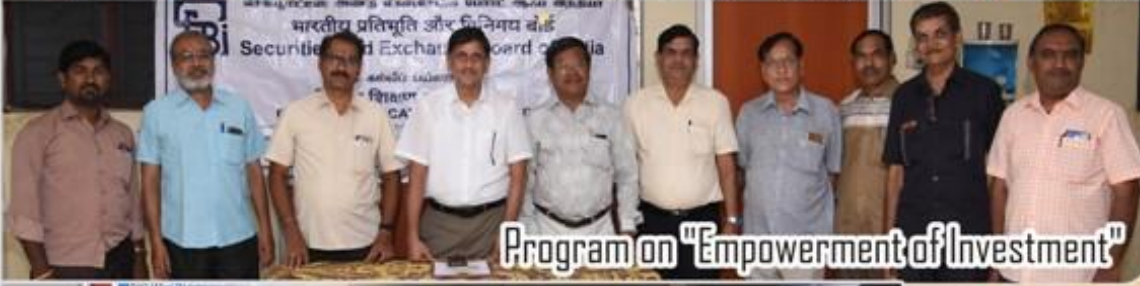
Program on "Empowerment of Investment"