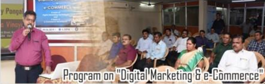
Program on "Digital Marketing & e-Commerce"