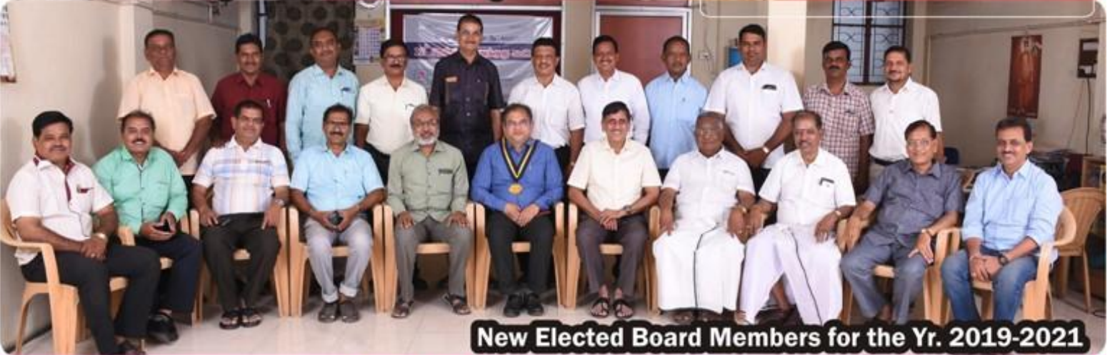
New Elected Board Members for the Yr. 2019-2021