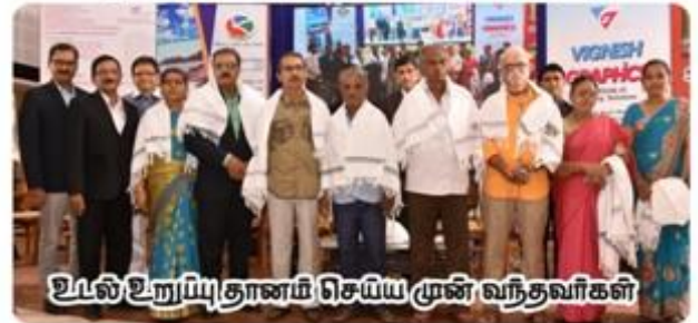
உடல் உறுய்யுதானம் செய்து முன் வந்தவர்கள்