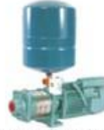
Pressure Boosting Systems