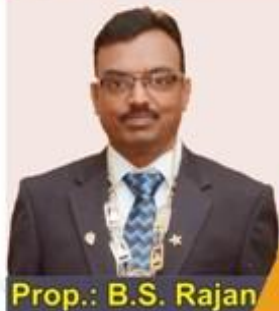
Prop.: B.S. Rajan