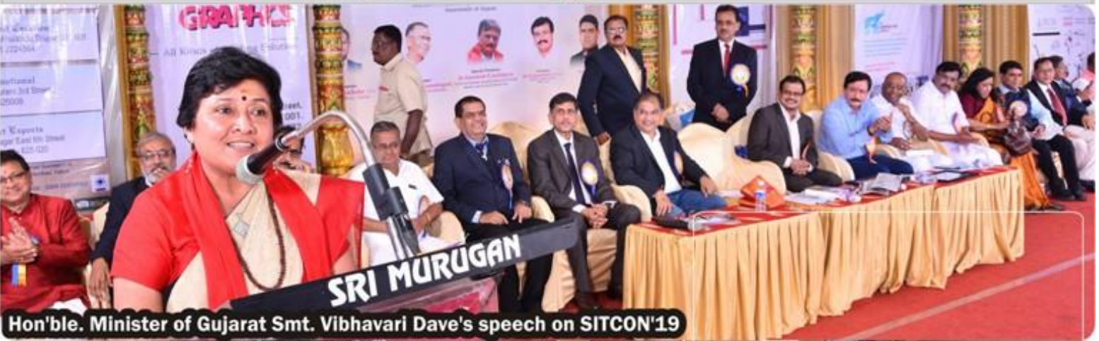
Hon'ble. Minister of Gujarat Smt. Vibhavari Dave's speech on SITCON'19

HEAD OFFICE : Plot No 264, LIG Colony, Off Lake View Road , KK Nagar , Madurai - 625 020 Contact : 81108 11180 Email: info@energyls.in